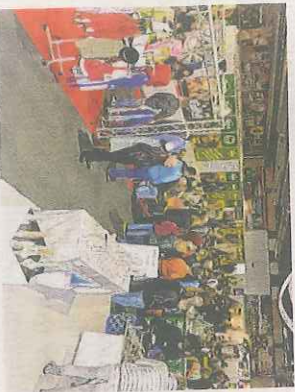
Auch Schärding dabei

Vorne mit dabei ist das Genussland Österreich mit einer Schauküche und vielen Schmankerln. Kost für zu Hause – Speck, Würste, Selchwaren, Bergkäse, Schittlbrot, Honig, Öl etc. – können Besucher außerdem bei einem Bauernmarkt oder an Ständen teils direkt vom Erzeuger erstehen. Zünftig bayerisch geht es in den Biergärten der Brauereien aus Passau und Umgebung zu, so die Veranstalter, die auch internationale Küche anknüpfen. Weine, Sekt und Spirituosen sollen das Angebot abrunden. Auch der Bezirk Schärding präsentiert sich auf der Passauer Messe.