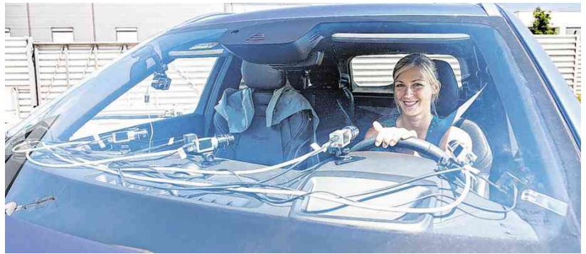
Der Autozulieferer Audio Mobil in Ranshofen arbeitet an der Minimierung der Ablenkung im Fahrzeug.

Zudem wird die Kommunikation untereinander erleichtert und verbessert. „Das System ist fertig, wir verhandeln gerade mit Autoherstellern“, sagt Stottan.