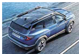
Robuste Optik: Heckspoiler, ausgestellte Radkästen, Dachreling