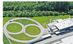
Firmenareal mit Teststrecke

Bereits in Serie hergestellt werden in Ranshofen derzeit Bildschirme und ein spezielles Steuergerät für ein Entertainmentssystem für die rückwärtigen Passagiere in Fahrzeugen des Luxusautoherstellers Rolls-Royce.