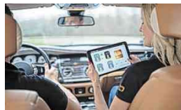
System von vier Hörzonen im Fahrzeug