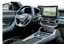
Bigster-Interieur mit großem, mittig platziertem Touchscreen

markiert ein 130-PS-Dreizylinder-Benziner mit 48-Volt-Mildhybrid. Dieser Motor ist kombiniert mit einem Sechsgang-Schaltgetriebe und Allradantrieb. Wer mit Frontantrieb das Auslangen findet, greift zum Dacia Bigster TCe 140 mit 140 PS und Sechsgang-Schaltgetriebe. Den Normverbrauch dieser Version gibt Dacia mit 5,6 Liter auf 100 Kilometer an.