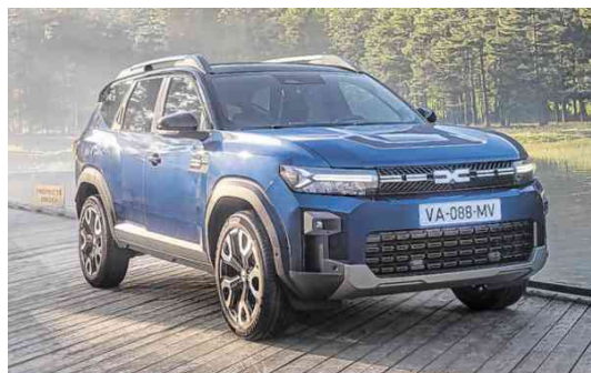
Dacia Bigster: Der Marktstart in Österreich erfolgt im Frühjahr 2025.

Bei den Antrieben orientiert sich der Dacia Bigster ebenfalls am Dacia Duster, geht dabei aber noch ein bisschen weiter: Diesel gibt es keinen, unter der Haube arbeiten ausschließlich Benzinmotoren. Die Triebwerke sind unterschiedlich stark elektrifiziert. Den Einstieg